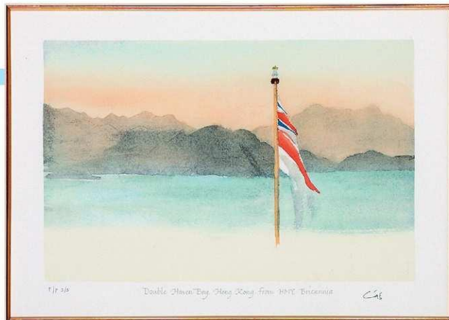
■皇室成員的藝術作品罕見，連大型博物館都好少收藏，港人可趁機欣賞一下，甚至買幅返屋企當年畫。這幅就是查里斯的水彩作品，雖不致大師級數，也不乏趣味。

土景觀，還包括香港呢！」王儲的真迹原畫，大部分收藏於其私人大宅 Highgrove House（海格羅夫樓）和辦公室 Clarence House（克萊倫斯宮）內。