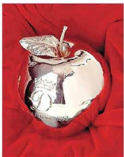
■查里斯送給已故前妻戴安娜的禮物「戴安娜蘋果」（Diana's Apple）。