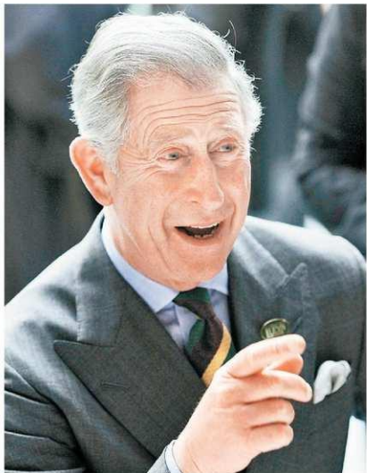
■英國王儲查里斯首次在香港舉行皇室畫展