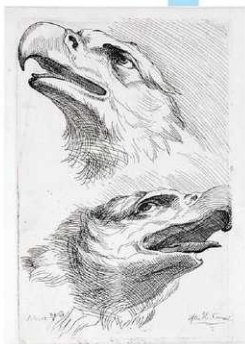
■愛德華王子作品 Two Eagles